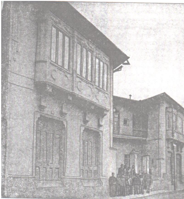
F. 23, Templo Iglesia Amigos Central, La Paz, Bolivia.

Los primeros esfuerzos de la Iglesia “Amigos” en Bolivia, se efectuaron en 1919, por la que, en 1926, llegó a ser la Junta Anual Central de Wéstfield, Indiana, EE.UU., a través de graduados del Seminario Bíblico “Unión”. Ése era un grupo independiente, y establecieron su trabajo en La Paz, de donde se han extendido hacia muchos lugares. También, han formado su propio Seminario, manteniendo una imprenta y un programa radial (The Góspel Múnister, p. 1, 2, 6, 7).