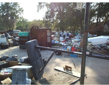
Tomamos la Foto al evacuar la casa por lancha.

Una gran parte del reto ahora es el esperar. La gente ha esperado – a que las lluvias cesaran; a que las aguas retrocedan a que haya ayuda para sacar todo de la casa; a que las paredes se secan; a que lleguen los ajustadores, contratistas e inspectores; a que lleguen los cheques de los seguros, FEMA, y otros; a conseguir materiales; y etc. Con el tiempo las cosas mejorarán, pero cuesta esperar. Sabemos que esta es la verdad en muchas áreas de la vida. Dios obra, pero Él definitivamente no ha terminado todavía. Jesús ha venido, pero el mundo no está restaurado o hecho nuevo. El amor de Dios ha entrado el mundo, pero aún su pueblo de Él no refleja en su plenitud aquél amor y gloria. Anhelamos su venida de nuevo para establecer justicia y paz, y mientras – esperamos.